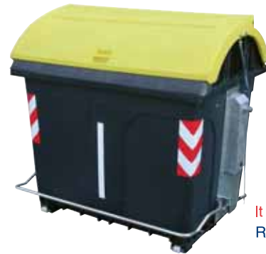
lt 2400 asimmetrico RSU