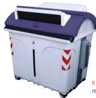
lt 2400 asimmetrico raccolta differenziata